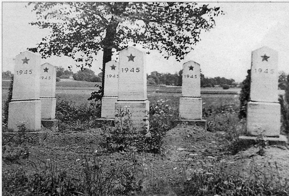
Захоронение советских солдат в Венгрии

Библиотекари решили отыскать точные данные. Поиск, уточнение и сверка данных происходили на основных сайтах «Память народа», объединённой базе данных «Мемориал» и краеведческом портале «Родная Вятка». Они регулярно обновляются, появляются новые документы. Их отмечают специальным